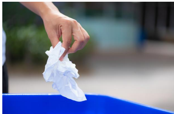
Приказ начина коришћења марамица

5. У случају сумње да сте заражени новим „корона“ вирусом (COVID-19) позовите телефоном епидемиолога института или завод за јавно здравље надлежног за подручје у коме боравите (листа бројева телефона дата у Прилогу 1).